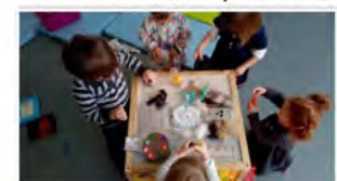
Les enfants vivent de belles aventures!