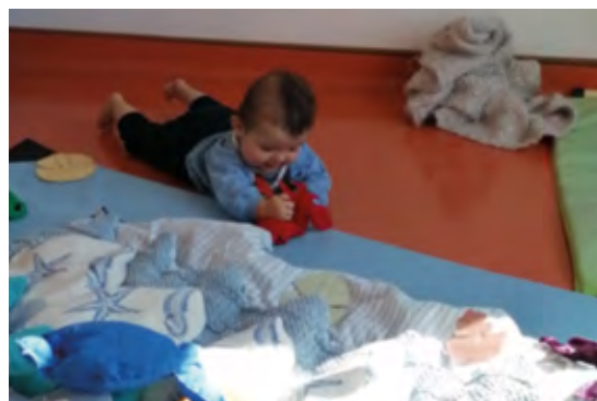
Le tapis « de la mer »

Pour le « tapis fleur », pensez aux grands pétales, sous lesquels se cachent les insectes.