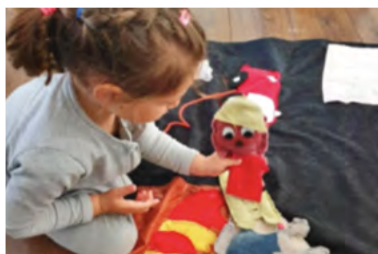
L'emprunt à la maison