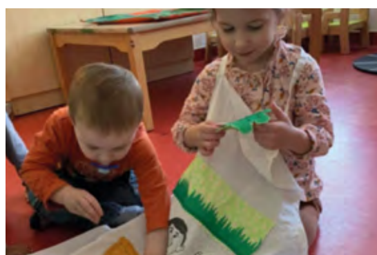
L'appropriation par les enfants